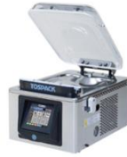
工業用真空包装機 V-392S